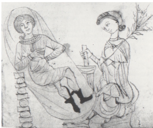
[1] Γυναίκα γιατρός εξετάζει έγκυο ασθενή της σε χειρόγραφο του 12ου αιώνα.

Επιστρέφοντας στην Ιταλία, θα επιχειρήσουμε να δούμε τι είχαν να αντιμετωπίσουν οι μορφωμένες Ιταλίδες γιατροί στην ενασχόληση τους με τον τομέα της ιατρικής. Εξετάζοντας την μεταχείριση των γυναικών γιατρών στην Ιταλία, θα επικεντρωθούμε στο πανεπιστήμιο του Σαλέρνο και κυρίως της Μπολόνια, καθώς και σε σημαντικές προσωπικότητες που σπούδασαν ή δίδαξαν εκεί. [εικ. 1]